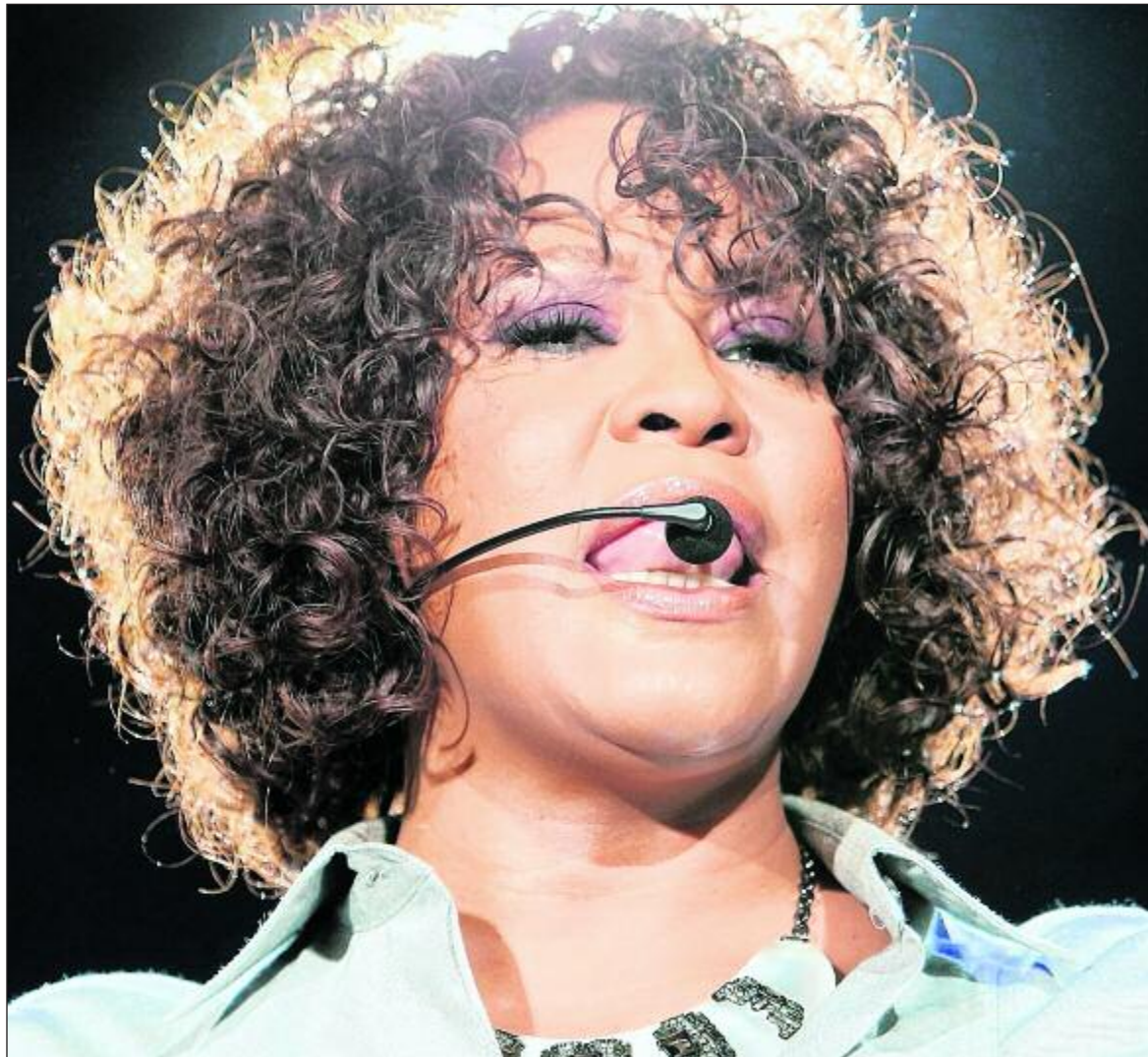
Whitney Houston in der Arena Leipzig.

Denjenigen Fans, die nicht vorzeitig die Leipziger Arena verließen, darf man jedoch eine edle Haltung attestieren – statt sich in Buh-Rufen