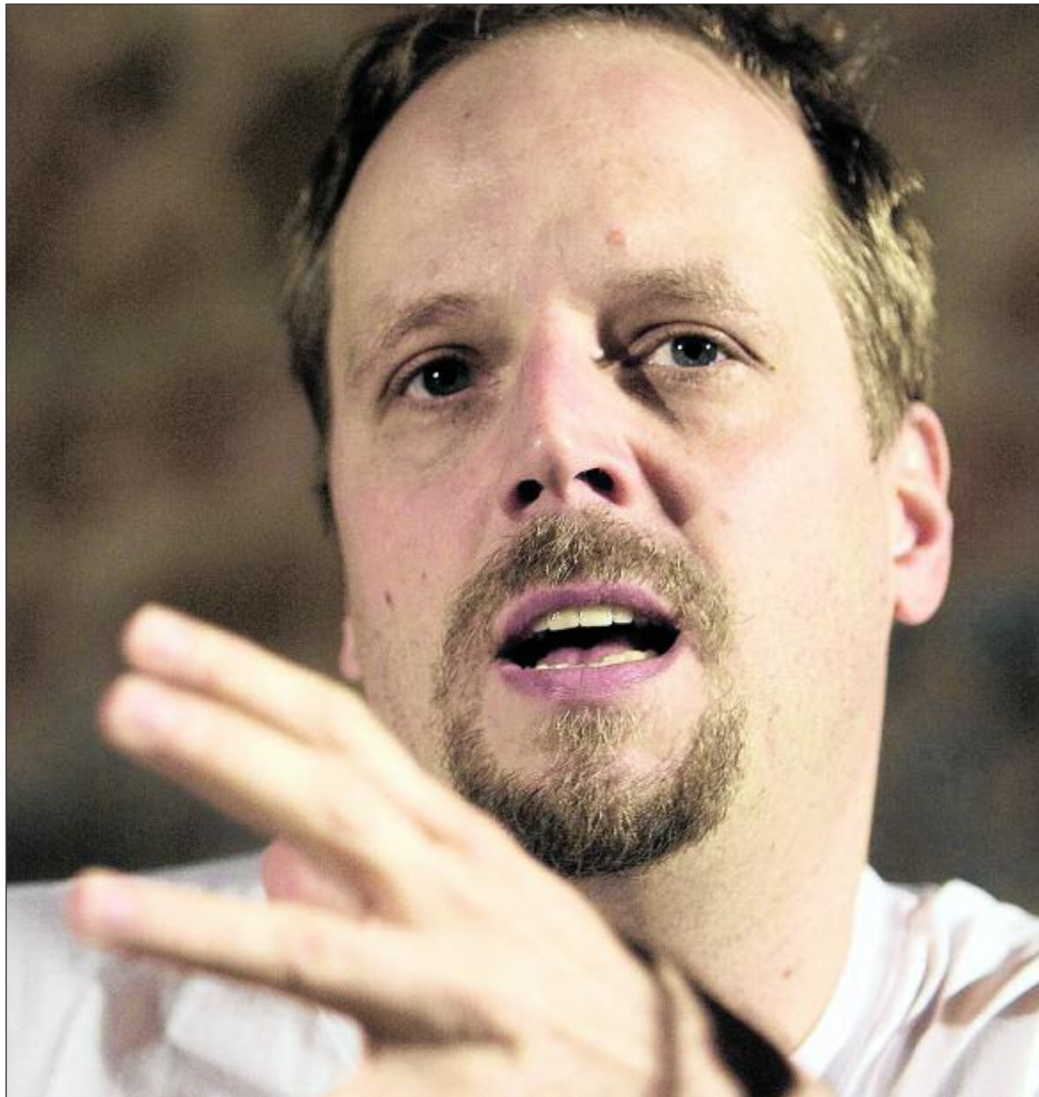
Smudo, Sänger der Fantastischen Vier.

Smudo: Ja, denn bis auf wenige Ausnahmen langweilt mich das Genre Hip Hop. Aber so ist das eben: Innovation und Qualität ist selten. Auf deiner Straße ist auch nicht ein Super-Italiener neben dem anderen (lacht). Heute ist Hip Hop längst im Mainstream angekommen. Wer etwas bewegen will, muss anders ansetzen. K.I.Z. aus Berlin zum Beispiel finde ich großartig. Die Band rebelliert radikal und persifliert sich dabei selbst. Das hält die Musik spannend, und ganz nebenbei bleibt so die deutsche Sprache auf dem musikalischen Menü.